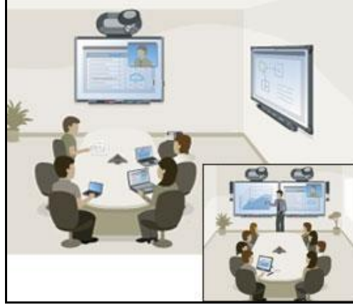
صورة 5: استخدام السبورة الذكية في التعليم عن بعد