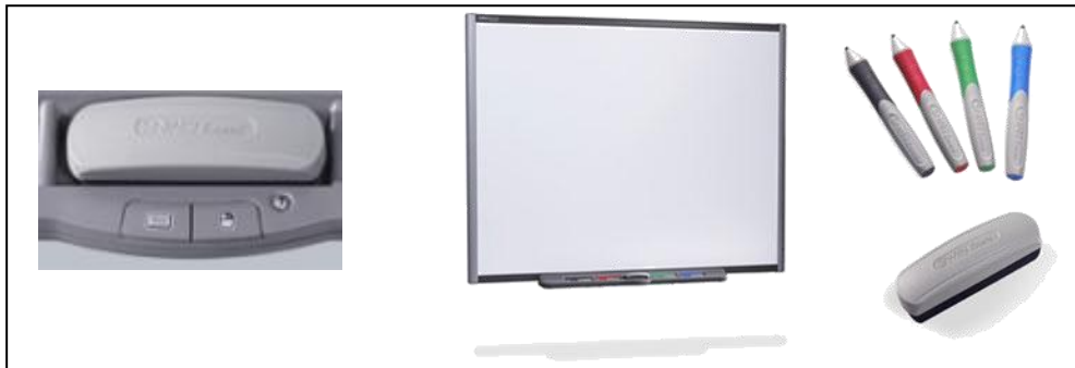
صورة 4: مكونات السيورة المادية

شاشة بيضاء تفاعلية - أربعة أقلام حبر رقمية - ممحاة رقمية - زر لإظهار لوحة المفاتيح على الشاشة - زر الفأرة الأيمن - زر المساعدة.