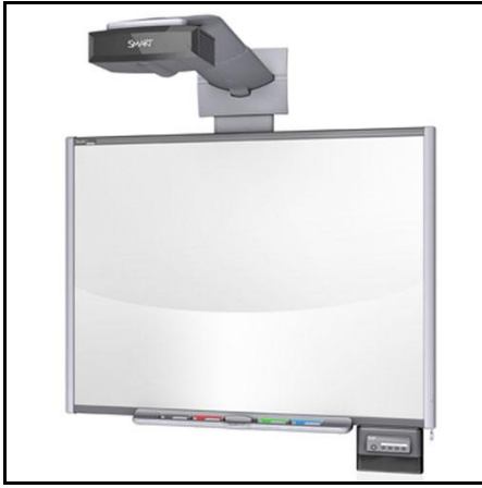
3: سيورة ذكية مع سماعات وكاميرا و داتاشو مدمج ومنافذ لتوصيل الطابعة والإنترنت

كما أن هناك بعض متطلبات التشغيل غير الأساسية ولكن وجودها يدعم وظائف السيورة الذكية مثل الكاميرا، والنظام الصوتي (سماعات ومضخم صوت) والطابعة.