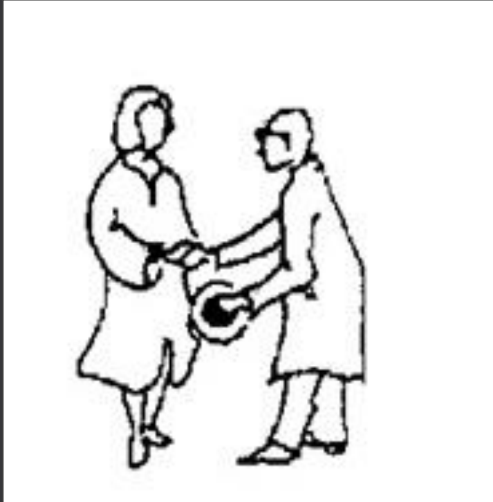
تبادل التحية والمعلومات

المحيط السكني كامتداد لفرانج النشاط والتفاعل الاجتماعي السلبي والنشط