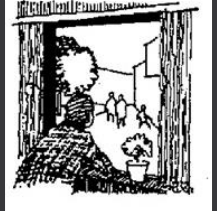
التفاعل السلبي عن طريق الرؤية والسمع