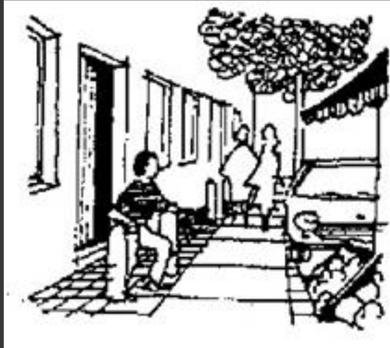
البيع، الراحة والمشي وتبادل المعلومات