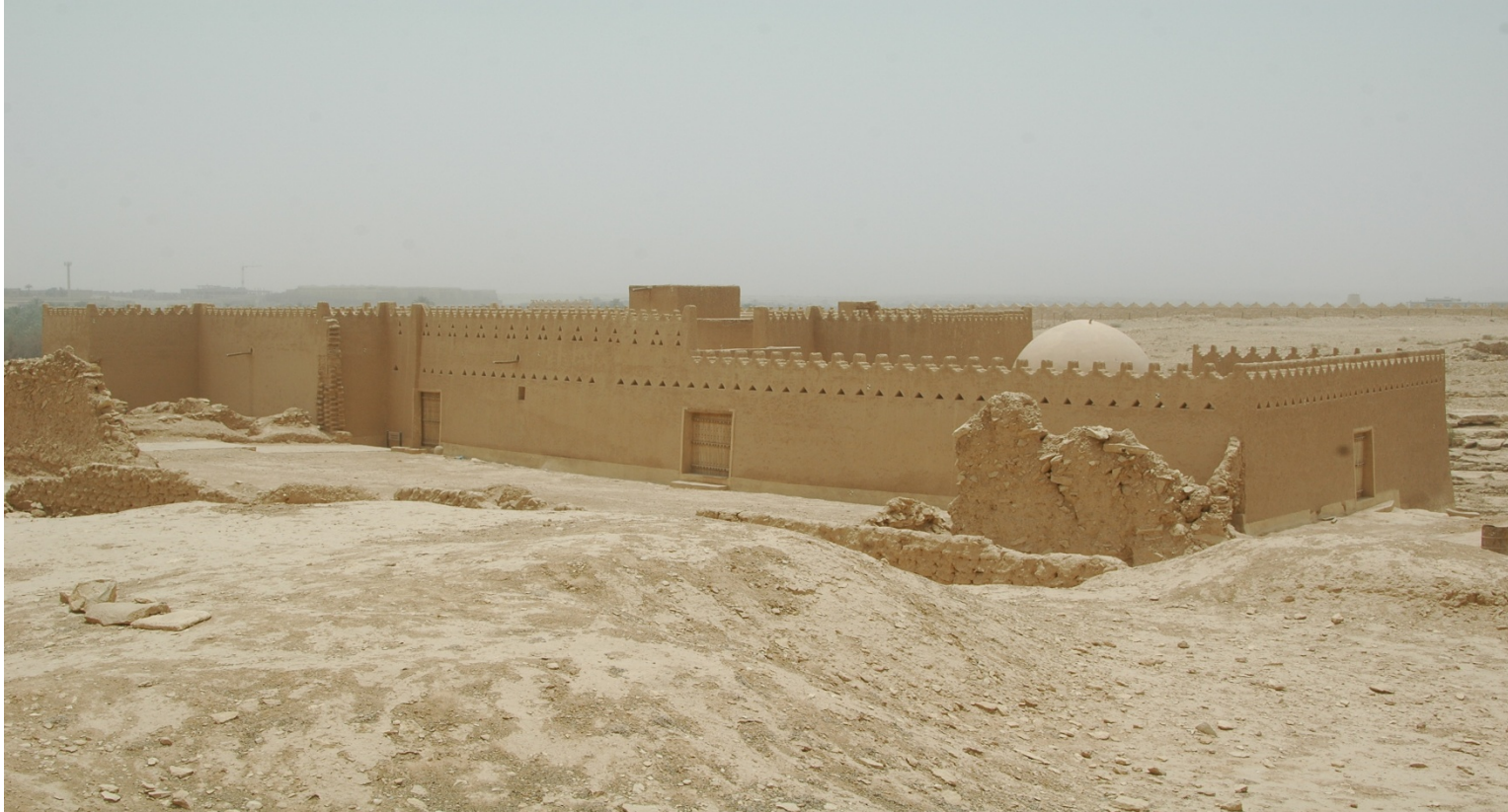
اللوحة رقم (8): حمام طريف