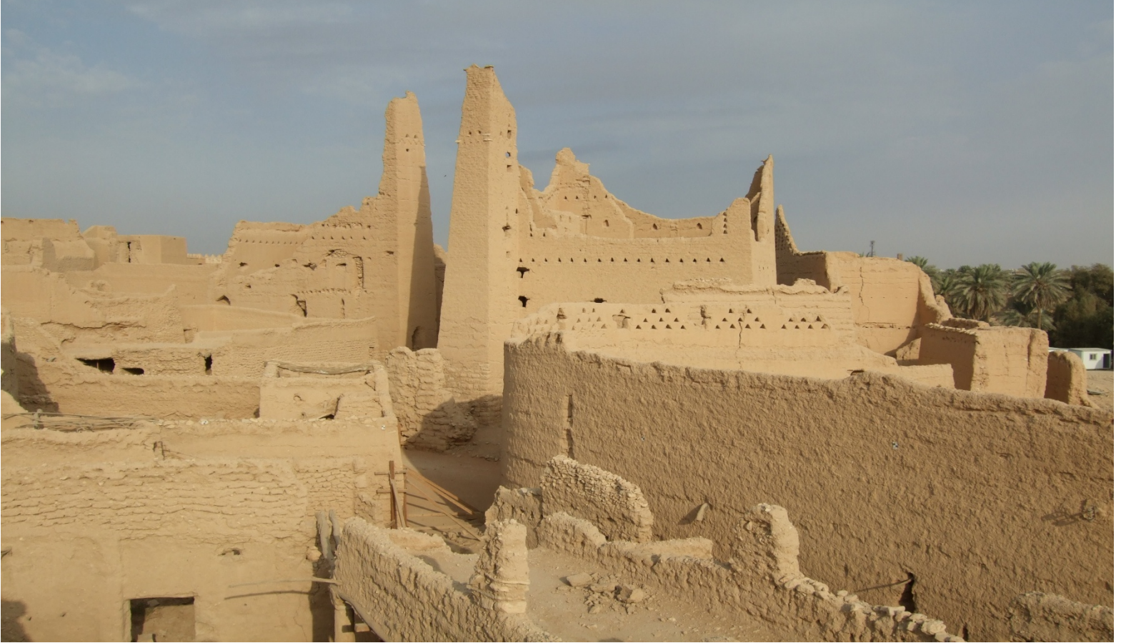
(اللوحة رقم 2): منظر عام لقصر سلوى