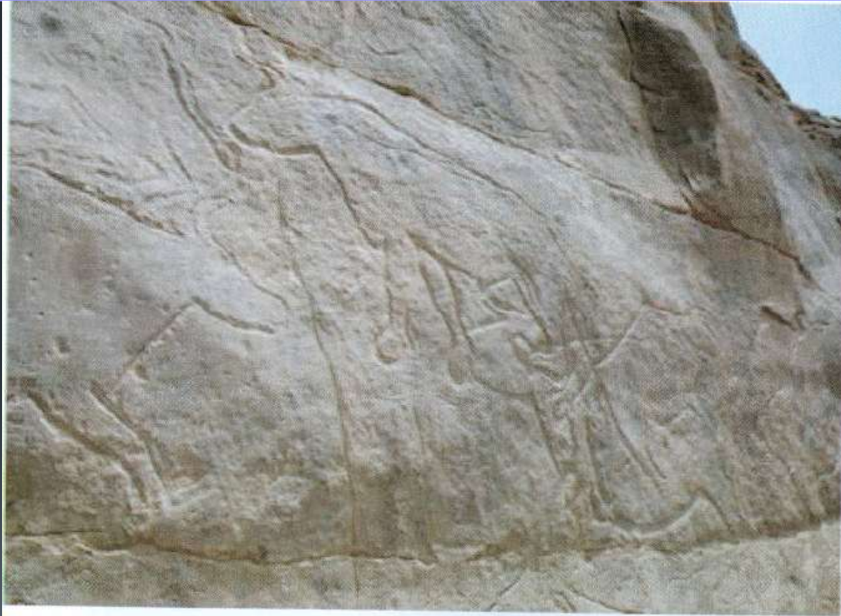
صوره (٦٩) أشكال حيوانات رسمت بطريقة الحفر على واجهة الجبل

وبهذه الطريقة ترسم الخطوط الخارجية للأشكال فقط ، وذلك باستخدام أداة حادة كحجر أو مسمار .