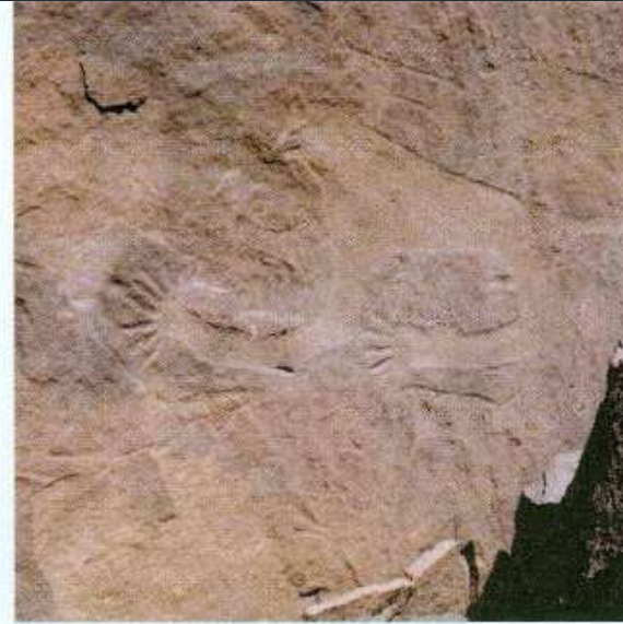
صوره (٦٦) نقر غير مباشر