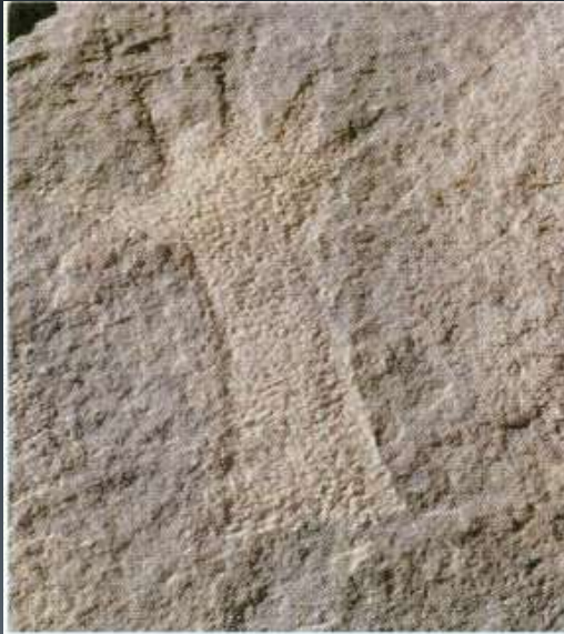
صوره (٦٧) النقر غير المباشر

في هذه الطريقة يقوم الفنان بإمساك أداة يطرق بها على حجر مدبب للنقش على الصخر ، وهي طريقة دقيقة وسليمة ، وطريقة النقر بنوعيه تستخدم للرسم على الصخور الرملية ، ٩٩% من النقوش الصخرية في المملكة رسمت بهذه الطريقة .