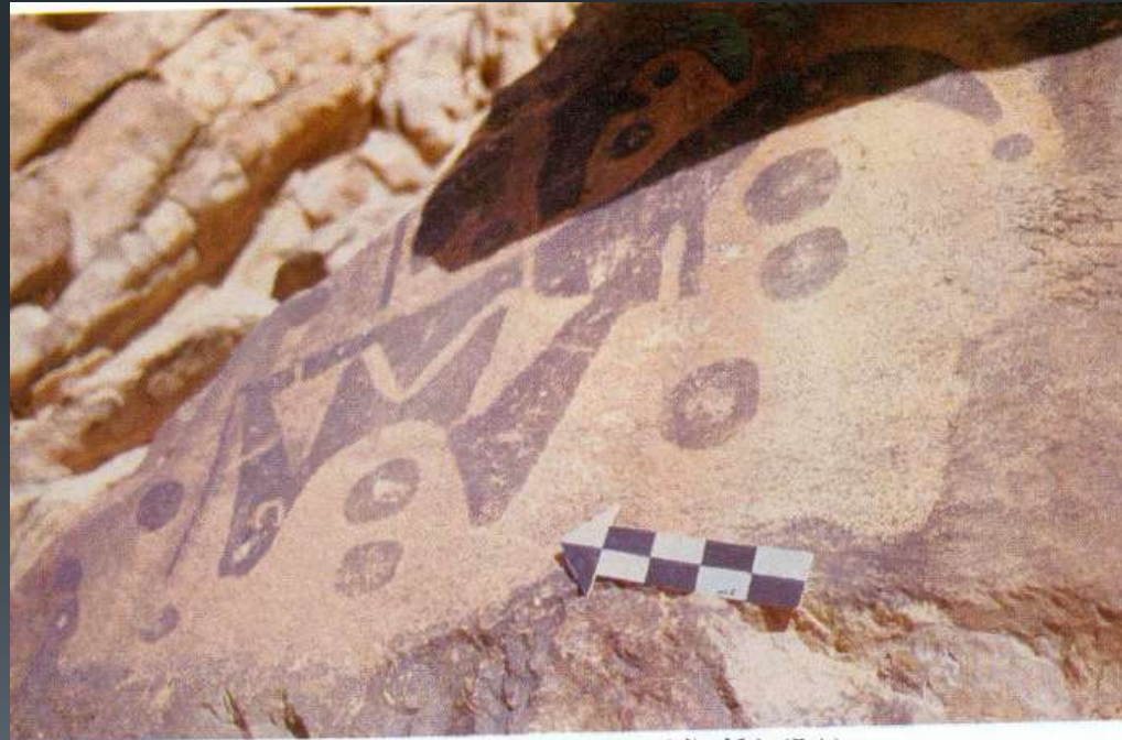
صوره (٦٨) شكل البقر رسمت بالحك على صخرة سوداء

في هذه الطريقة يقوم الفنان بحك الصخر وكشطه بأداة في يده ، وهذه الطريقة تستخدم مع الصخور الجرانيتية حيث أنها قاسية جداً ولا يمكن الرسم عليها بطريقة النقر ، وكذلك فإن هذه الصخور سوداء بسبب وجود عنصر الحديد فيها ، ولا تظهر عليها الرسومات بالنقر .