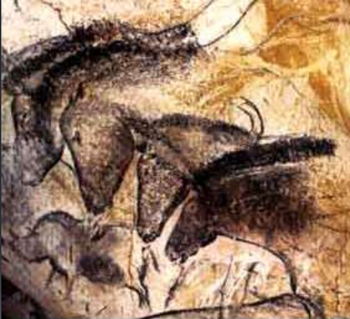
Rock paintings in Chauvet Cave, France, dated to approximately 30 000 to 32 000 years BP.

رسومات صخرية من كهف شافويت. فرنسا. تؤرخ من حوالي 32000-30000 سنة مضت