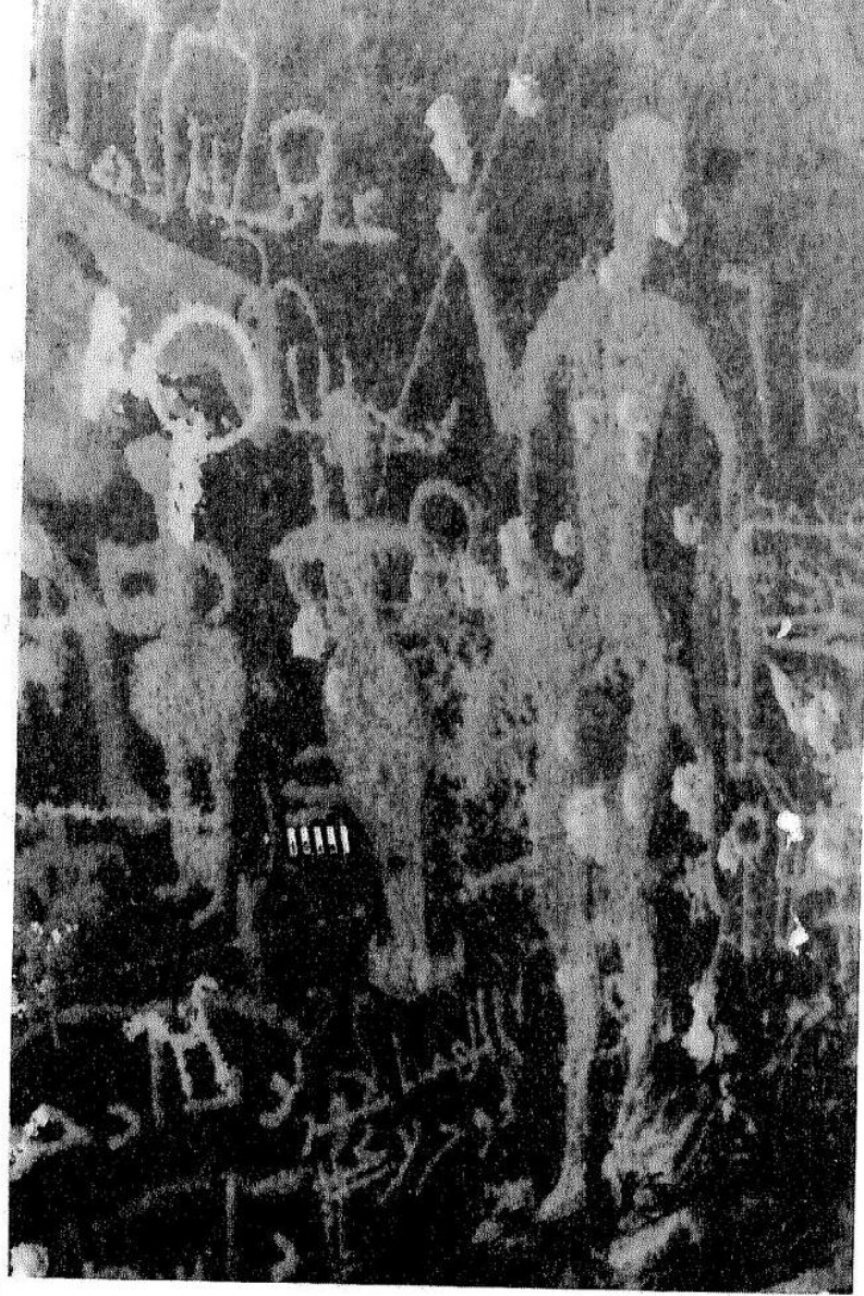
شكل ٤:٤:٤ مجسم من منطقة " غنال جمال " و " صمت الندهام " مع العديد من الأشكال البشرية بالحجم الطبيعي ، ادهم يبدو لإمرأة