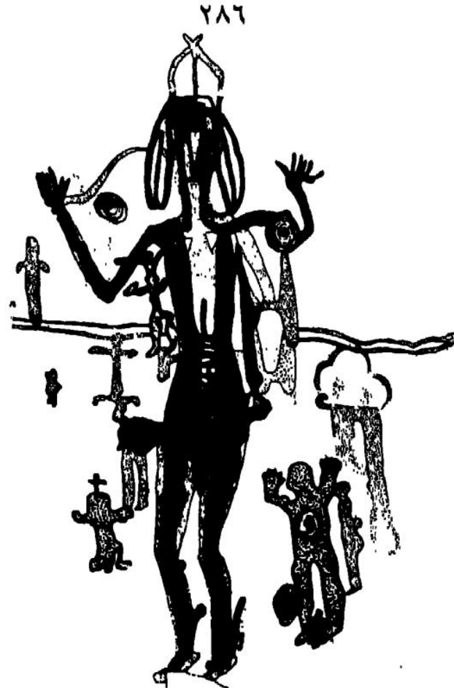
شكل ٤:٤ : أعلى : مجسم بشري بالحجم الكامل من نزل السميعة بالقرب من " ابار العين "