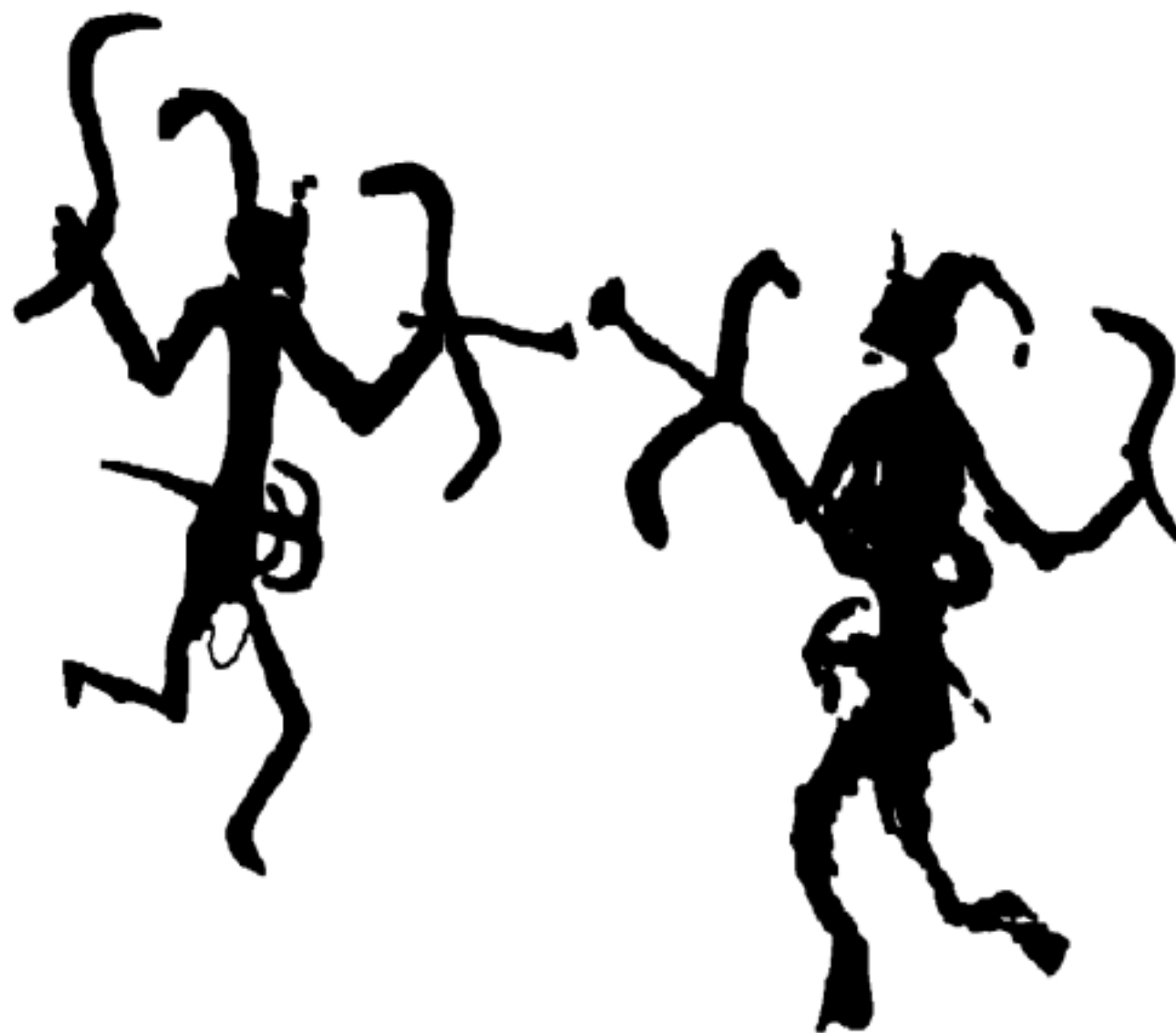
شكل ٣٩:٤ منظر من جبال قارة : شكلان آدميان يحملان إسلحة ، في هيئة قتال