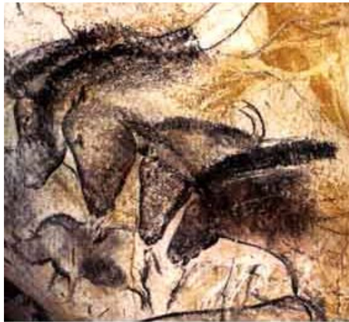
Rock paintings in Chauvet Cave, France, dated to approximately 30 000 to 32 000 years BP.

رسومات صخرية من كهف الالاسكو فرنسا. البلايستوسين الى الهولوسين