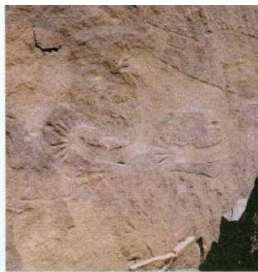
صوره (٦٦) نقر غير مباشر