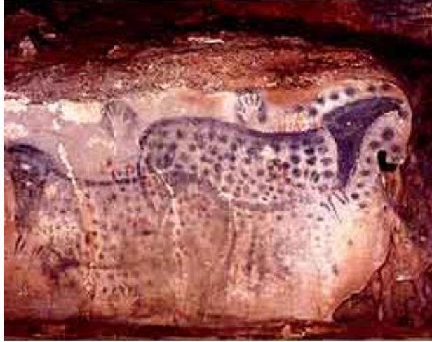
The 'spotted horses' in Pech Merle, a cave art site in France, probably Palaeolithic.

رسومات بكهف بيتش بفرنسا ربما تعود للعصر الحجري القديم