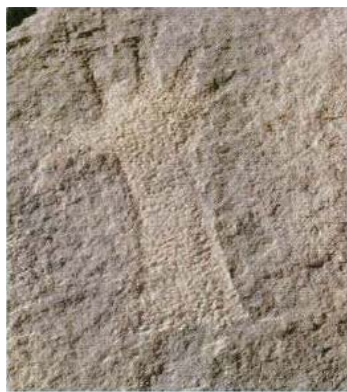
صوره (٦٧) النقر غير المباشر

2. النقر غير المباشر: في هذه الطريقة يقوم الفنان بامساك اداة يطرق بها على حجر مدبب للنقش على الصخر ، وهي طريقة دقيقة وسليمة ، وطريقة النقر بنوعيه تستخدم للرسم على الصخور الرملية.