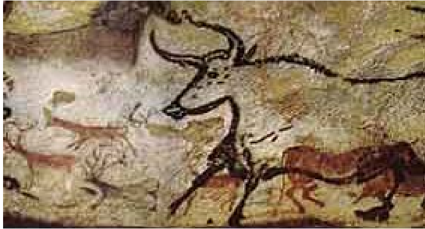
Lascaux cave art, France. The large bovine figure is probably of the Holocene, the earlier motifs may well be of the Pleistocene.

رسومات صخرية من كهف الالاسكو فرنسا. البلايستوسين الى الهولوسين