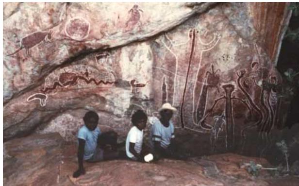
Aborigines at Australian pictogram site