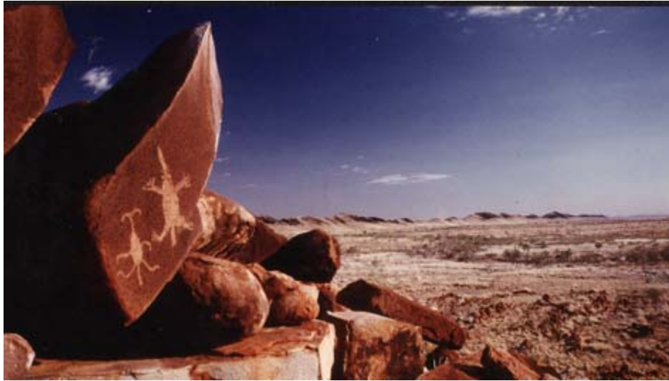
Petroglyphs at deeply patinated site in the Pilbara of Australia

تتعرض الصخور لتغيرات كثيرة مثل التآكل أو التحول وبالتالي استخدم تغير سطح الصخور في توريخ النقوش. مع ذلك فان هناك خطورة في استخدام هذه الطريقة لان الصخور تختلف اختلافا كبيرا، اعتمادا على الصخر نفسه والمناخ والتضاريس، والبيئة الكيميائية وغيرها من العوامل. ثانيا، لا توجد طريقة مبسطة لقياس مثل هذه التغيرات.