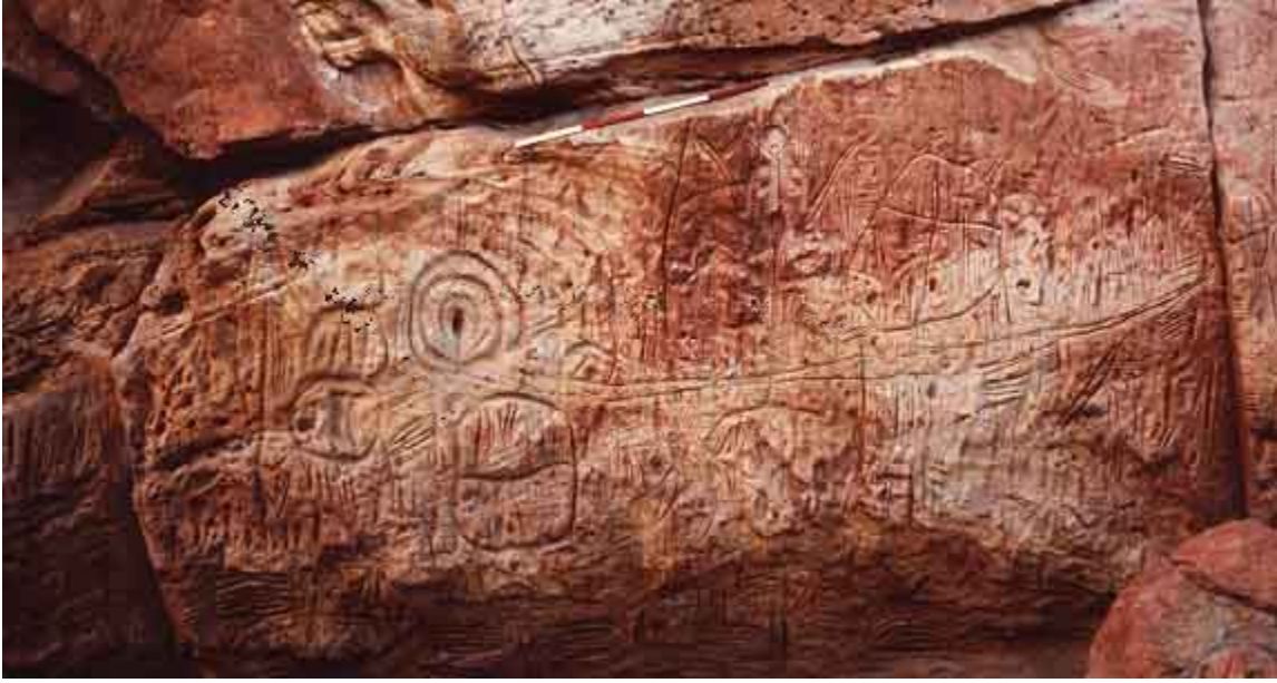
رسم تصويرى على حجر رملى - استراليا