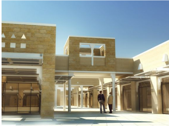
صورة (٩): المنطقة المركزية في المشروع