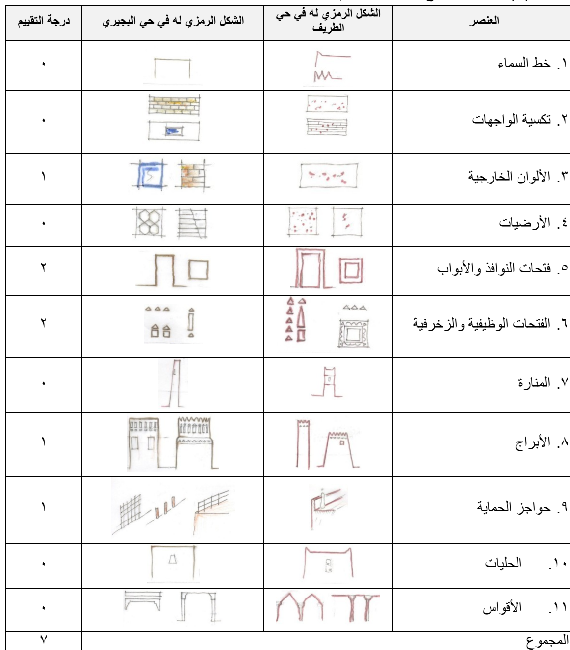
جدول (١): ملخص نتائج عناصر التقييم

إن الحكم على العناصر المعمارية التي يرتبط بها وبدرجة كبيرة تقييم جمالي؛ فيه نوع من الصعوبة، ذلك أن الجمال ذوقي؛ وتختلف معه آراء الناس، لذلك وضع مقياس استرشادي مكون من خمسة درجات لتقريب الحكم على الدرجة المتحصل عليها، وهو على النحو الآتي: