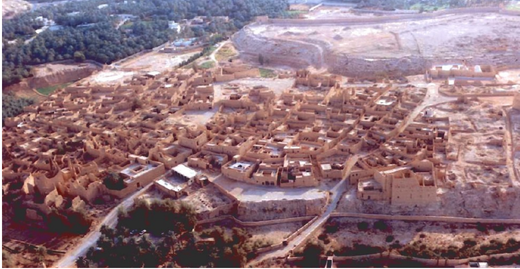
صورة (٤): تصور جوي لحي الطريف

وتنقسم الخطة التنفيذية إلى مرحلتين، مرحلة أساسية ومرحلة تكميلية، حيث تحتوي المرحلة الأساسية على ثلاثة مشاريع تطويرية هي مشروع تطوير حي الطريف، ومشروع تطوير حي البجيري، ومشاريع الطرق وشبكات المرافق العامة.