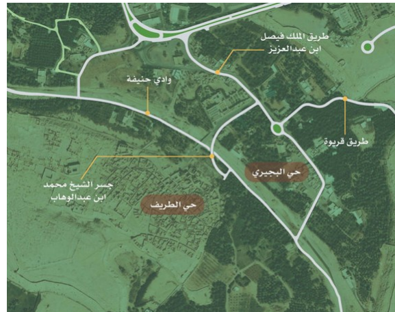
صورة (١): موقع التطوير في حي البجيري والطريف.

يجمع برنامج تطوير الدرعية التاريخية بين المحاور: العمرانية، والثقافية، والاقتصادية، والاجتماعية، وبين متطلبات التطوير البيئي لوادي حنيفة، ويشكل نموذجاً لعمران الواحات. وينطلق البرنامج الذي وضعته الهيئة العليا لتطوير مدينة الرياض، وتنفذه بالتعاون مع الهيئة العامة للسياحة والآثار، ومحافظة الدرعية، من مقومات الدرعية المتمثلة في قيمتها التاريخية والسياسية والثقافية، وتراثها العمراني، وموقعها الفريد على ضفاف وادي حنيفة، لذا اعتمد البرنامج، مبدأ التكامل مع مدينة الرياض، بحيث تكون الدرعية ضاحية ثقافية، سياحية، ترويحية بمستوى عالمي.