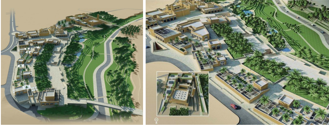
صورة (٦): مشروع تطوير حي البجيري.

يتمتع حي البجيري بأهمية علمية حيث يعد الجامعة الأولى في نجد التي خرجت الأجيال من علماء الدعوة السلفية، ويقع الحي على الضفة الشرقية من وادي حنيفة وبه مسجد الشيخ محمد بن عبد الوهاب وهو أهم معلم في الحي، ويضم البجيري إلى جانب هذا الجامع عدداً من المساجد والكتاتيب التي أسهمت في الثراء العلمي وانتشار العلم في الدرعية وفي نجد والجزيرة العربية بشكل عام. ولهذه الأهمية التاريخية للحي نفذت فيه عدد من المشاريع التطويرية أبرزها: