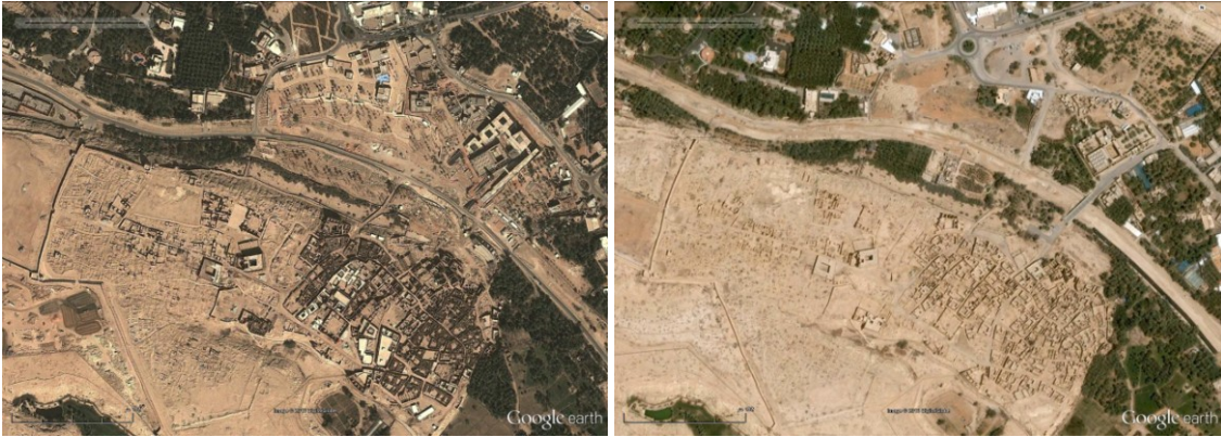
صورة (٧) مصور جوي لحي البجيري - أعلى الصورة شمال وادي حنيفة - قبل وبعد التطوير.

وتوضح المصورات الفضائية شكل الحي قبل بدء مشروع التطوير، وشكله بعد اكتمال المشروع، ومما يلاحظ أن التخطيط العمراني للمشروع التطوير راعى النمط التراثي بدرجة مقبولة، لذلك لم يكن هو مجال الدراسة، إنما توجهت الدراسة للعناصر المعمارية، وبالتحديد الخارجية منها.