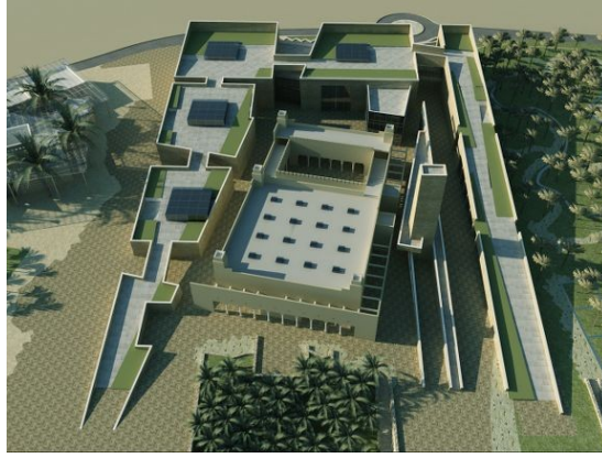
صورة (٨): مؤسسة الشيخ محمد بن عبد الوهاب