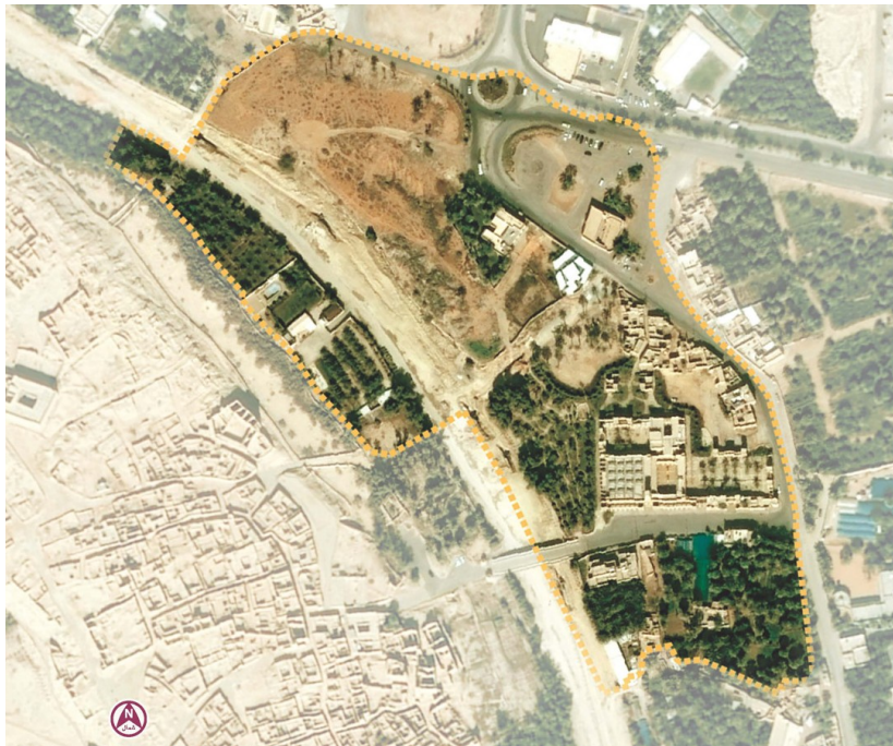
صورة (٥): حدود مشروع تطوير حي البجيري.

كما وضعت الهيئة خطة للإدارة والتشغيل، تتولى بموجبها الهيئة أعمال التخطيط والتنفيذ، والتشغيل والصيانة، فيما تتولى الهيئة العامة للسياحة والآثار، تشغيل وإدارة حي الطريف، واستقطاب الاستثمارات الاقتصادية والسياحية لكامل الدرعية التاريخية.