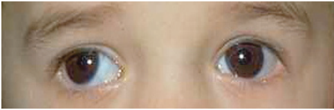
حول وحشي (إنحراف العين للخارج)