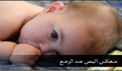
منعكس المص عند الرضع