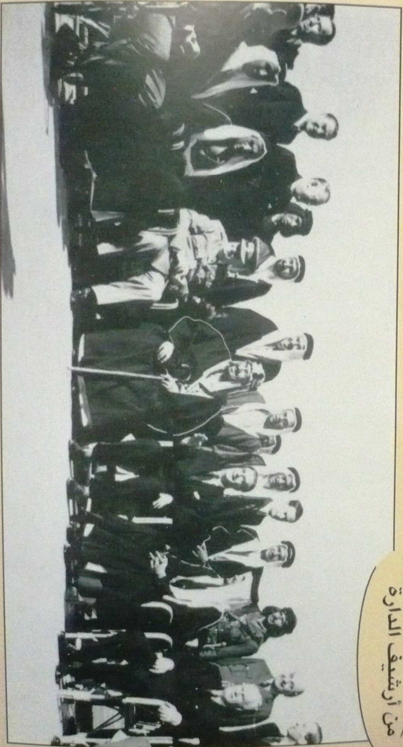
جلالة المغفور له الملك عبد العزيز، أثناء الاجتماع التاريخي مع رئيس وزراء بريطانيا ونستون تشرشل، في مدينة الفيوم بمصر يوم ٢ / ٣ / ١٣٦٤ هـ الموافق عام ١٩٤٥ م.