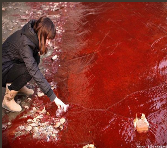
مجموعة مزارع الريدية