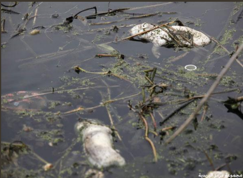
مجموعة مزارع الريدية