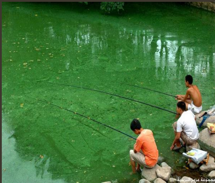
مجموعة مزارع الريدية