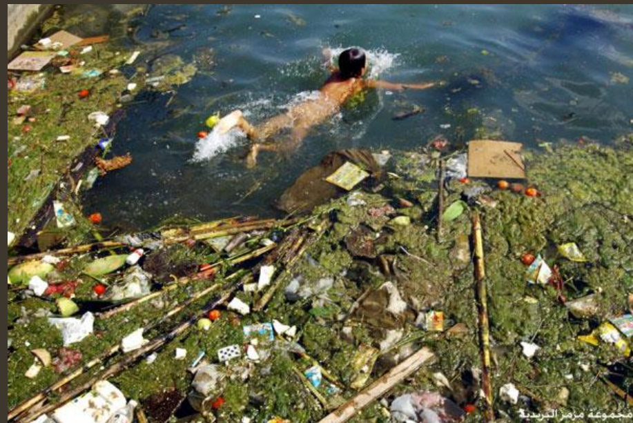
مجموعة مزارع الريدية