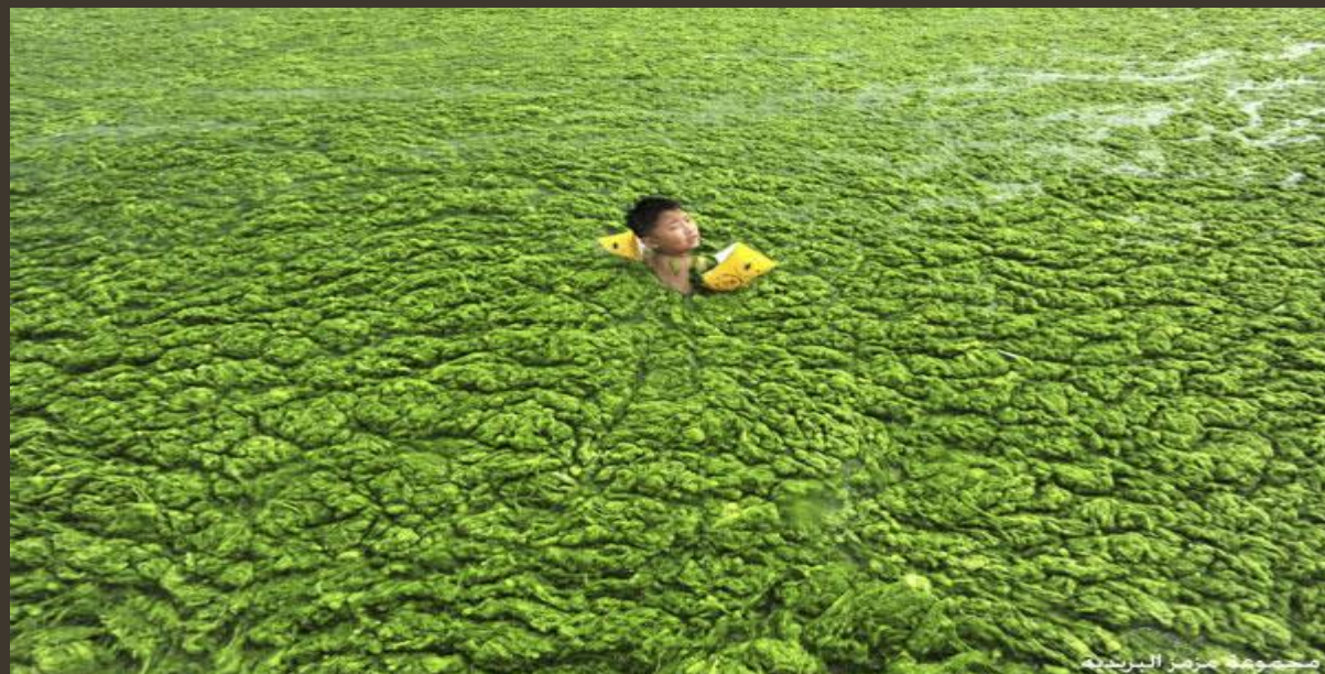
مجموعة مزارع الريدية