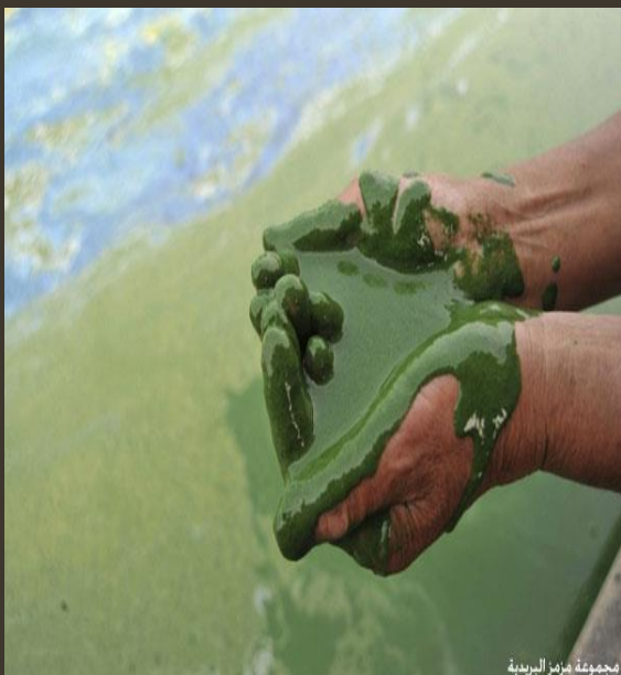
مجموعة مزارع الريدية