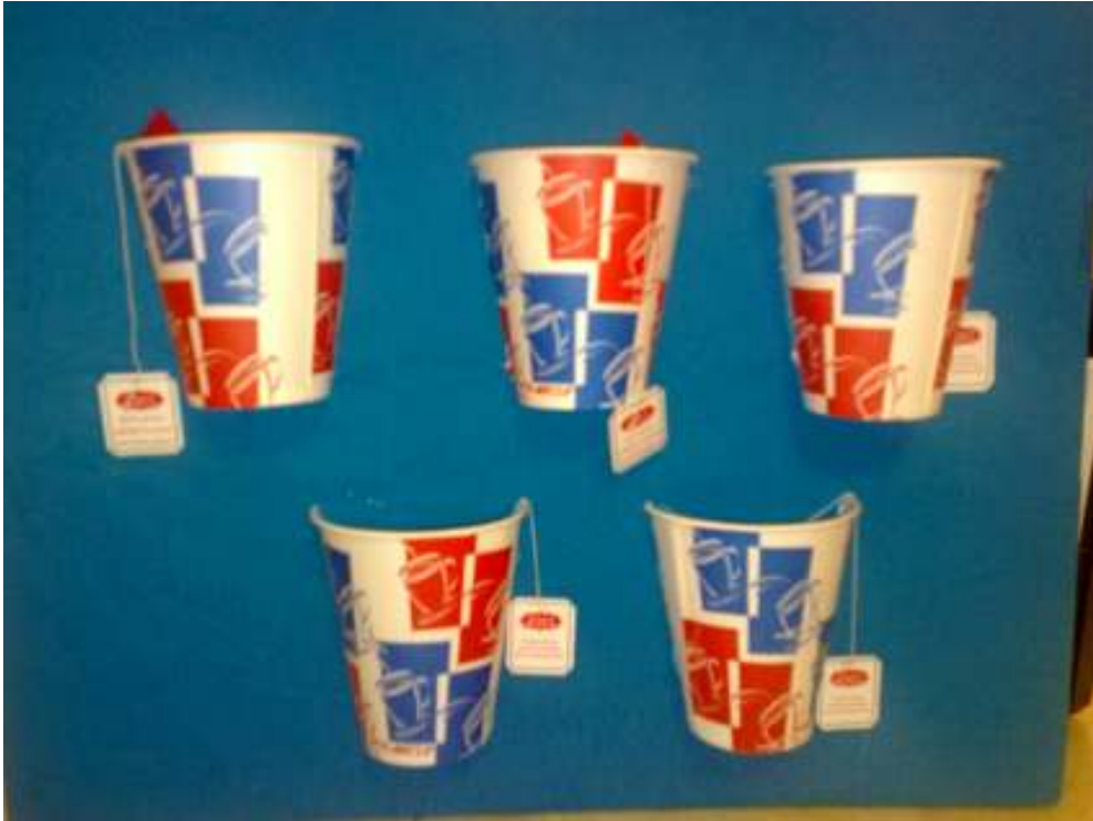
لعبة أكواب الشاي (وسيلة تستخدم للصيانة في مادة القراءة والرياضيات والإملاء)