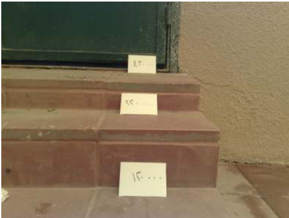
ترتيب الأعداد على الدرج (وسيلة صيانة لترتيب الأعداد)