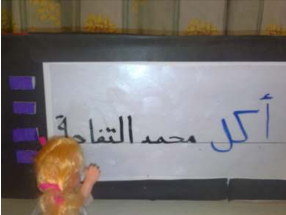
قصة الفتاتين والتلفاز (وسيلة تمهيد التهجئة )