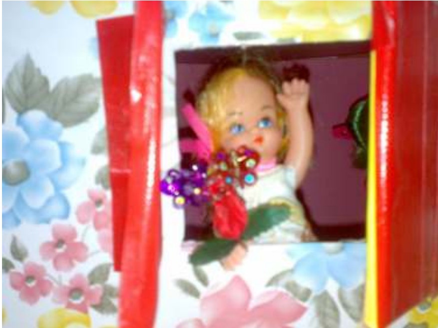
دمية التاء المربوطة