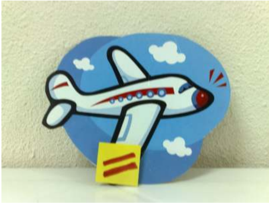
قصة الطائرة وعلامة تنوين الكسر (وسيلة تمهيد الكسر)