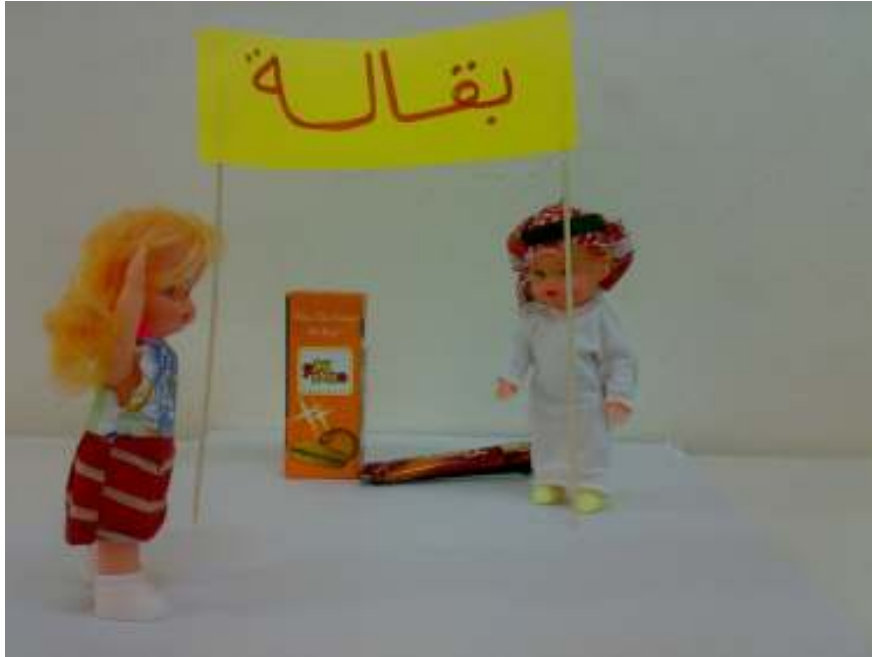
قصة سحر والبائع (وسيلة تمهيد الجمع بدون حمد)