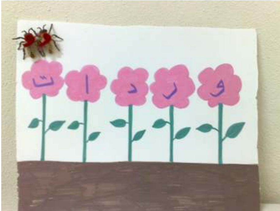
قصة النحلستان والوردات (وسيلة تمهيد تنوين الضم)