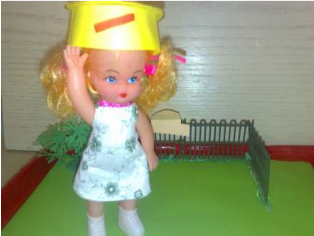
قصة الفتاة وقبعة حركة الفتحة (تمهيد حركة الفتحة)