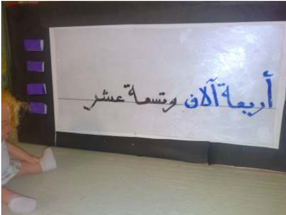
قصة الفتاتين والتلفاز (وسيلة تمهيد كتابة الاعداد )