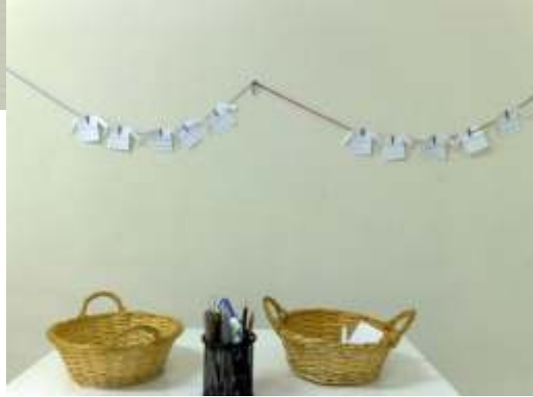
نشر الغسيل (وسيلة صيانة لمادة القراءة والرياضيات والإملاء)