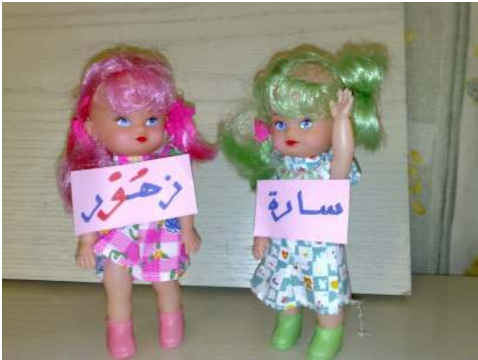
قصة دمية سارة وزهور (وسيلة تمهيد مد الواو)