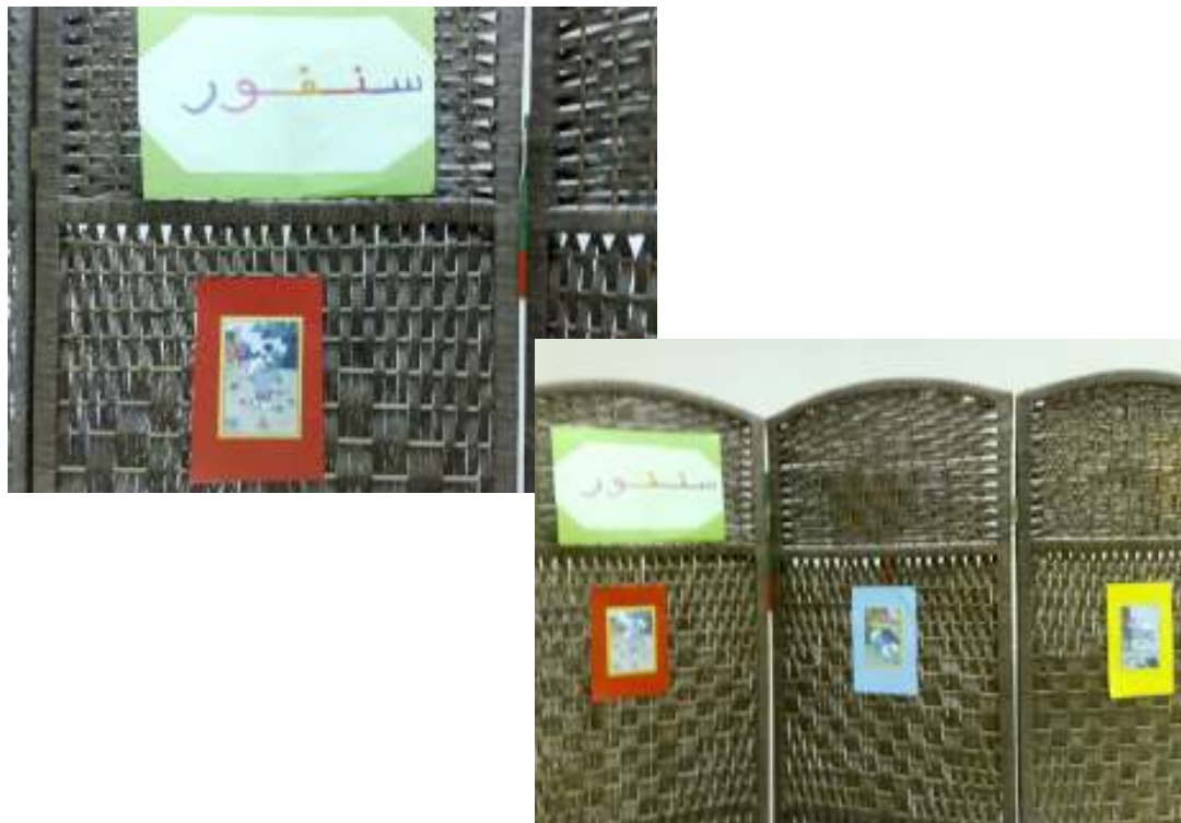
رسالة سنفور وسيلة صيانة في مادة القراءة (مد الواو)