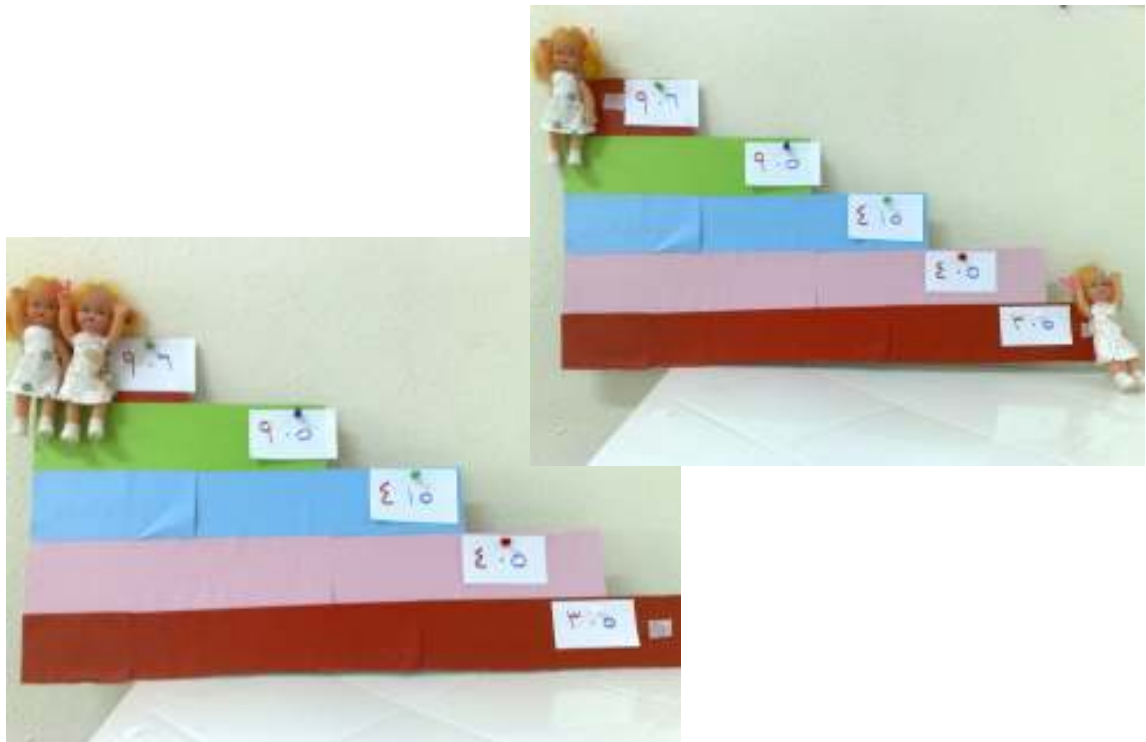
وسيلة تمهيد لترتيب الأعداد تصاعدياً وتنزلياً