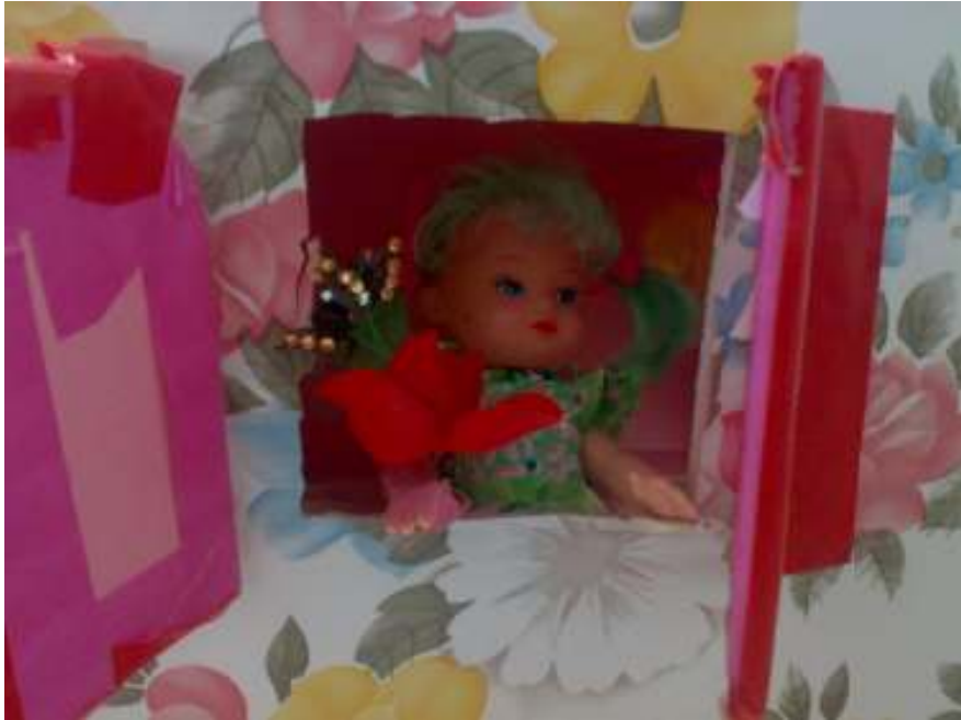
دمية التاء المفتوحة