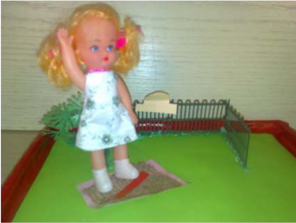
قصة الفتاة وبساط حركة الكسرة (تمهيد حركة الكسرة)