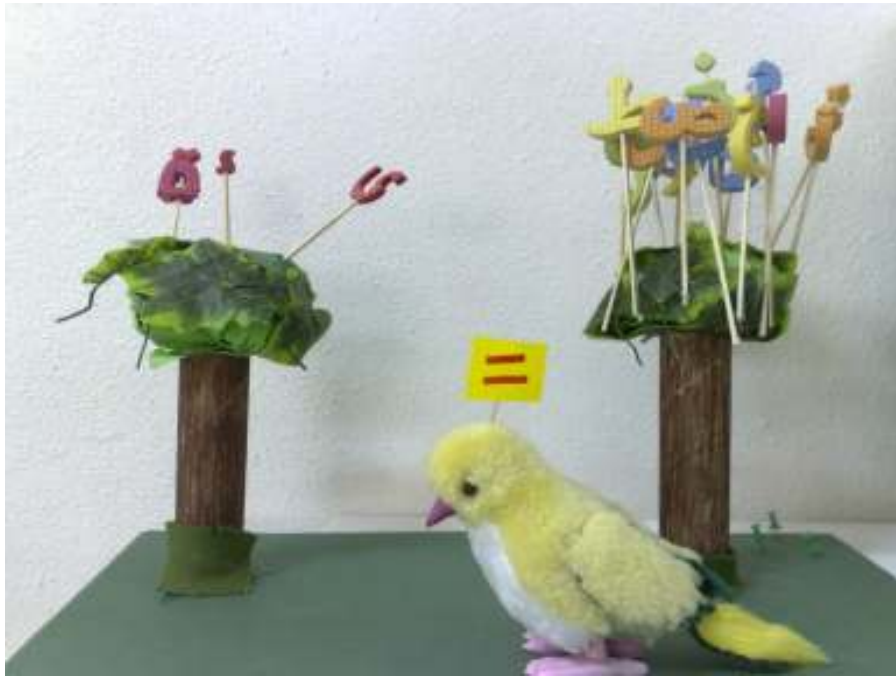
قصة عصفور تنوين الفتح (وسيلة تمهيد لتنوين الفتح للكلمات التي تلحقها ألف والكلمات التي لا تلحقها ألف)