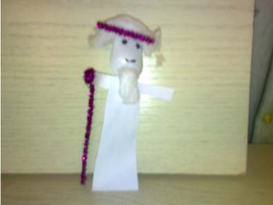
قصة الشيخ الكبير في السن والعصا التي يستند عليها (تمهيد مد الألف)