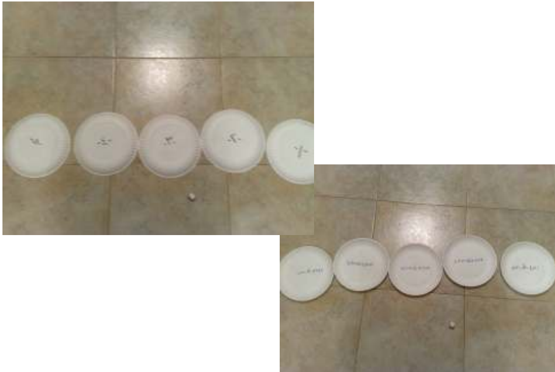
لعبة مكعب الأعداد (وسيلة صيانة لمقارنة الأعداد)