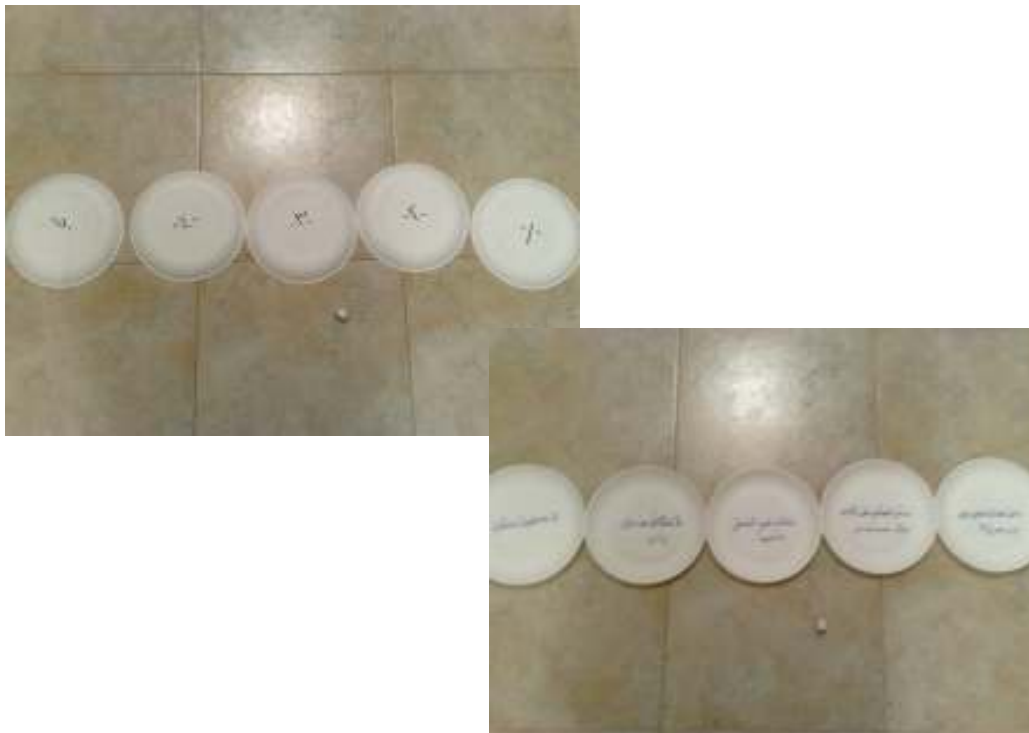
لعبة مكعب الأعداد (وسيلة صيانة لمادة القراءة)