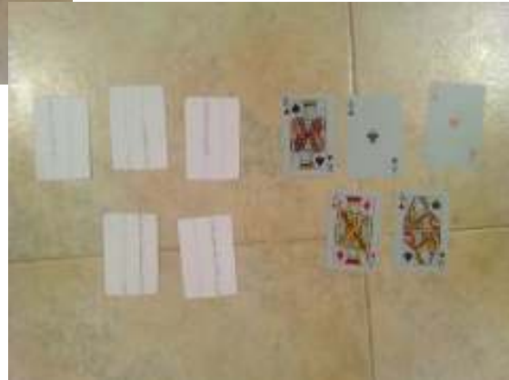
الكوتشينا (وسيلة صيانة لمادة القراءة والإملاء)