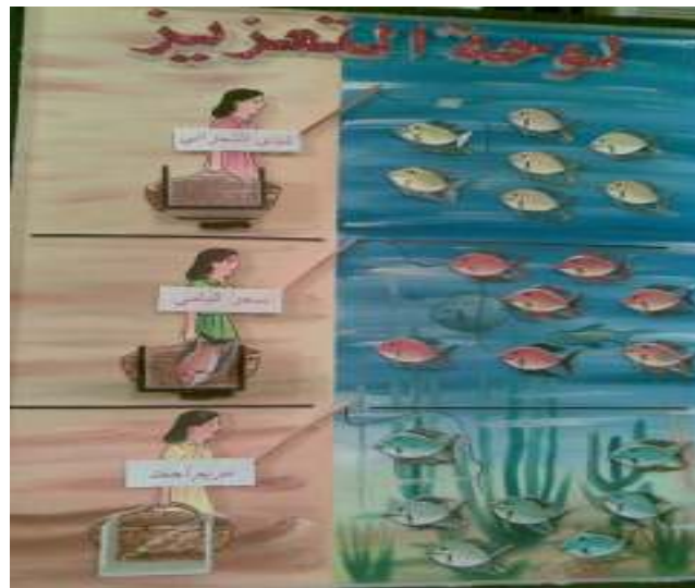
لوحة تعزيز ركن الورود