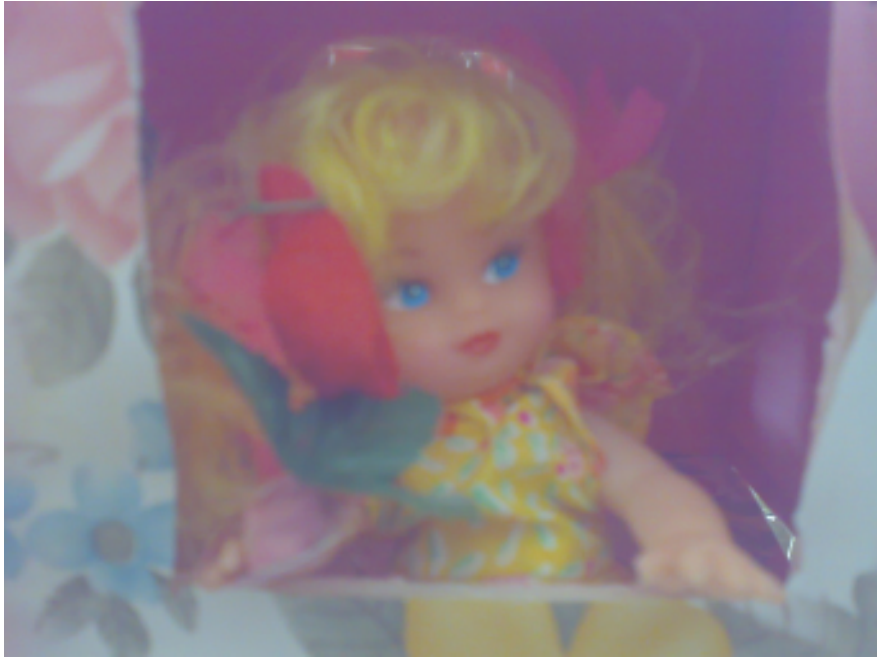
دمية الهاء في نهاية الكلمة