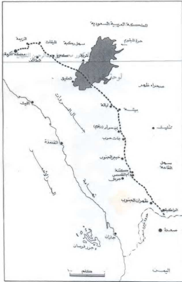
خارطة توضح مواقع النقوش الثلاثة على طريق الحج اليمني الأعلى (النجدي)