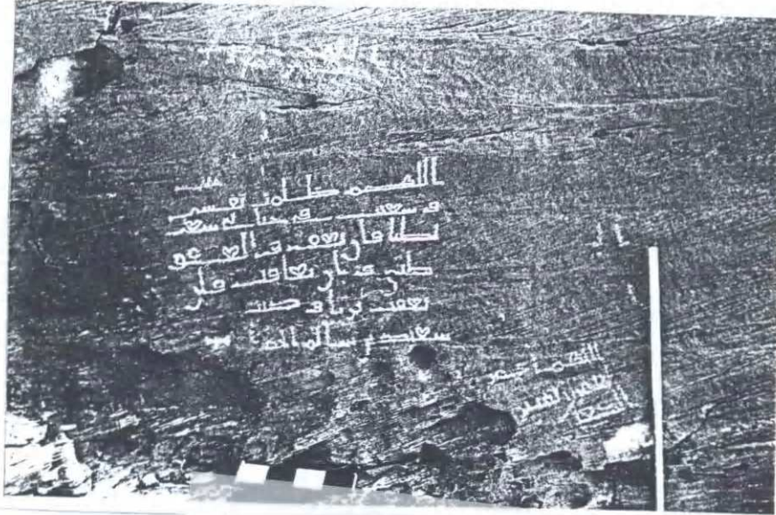
لوحة رقم : ٢

الفهم ظالمه تقسم في سبب في حالك سبب كما قال يهف واليه طلي ومار يعاقب وار يعقب وربما في سبب من سالم المام نقش جبل الراكبة